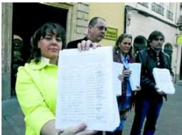
Representantes de la plataforma muestran las firmas entregadas ayer a la Junta.